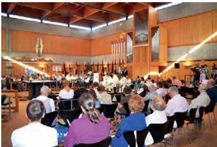
Festgottesdienst zum 40-jährigen Jubiläum am 7. Juli 2012