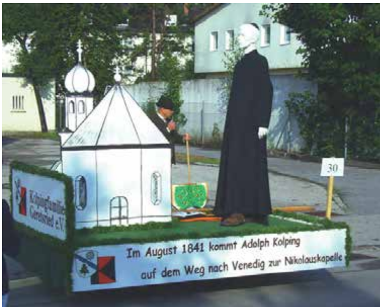
Festwagen der Kolpingsfamilie zum 60-jährigen Jubiläum der Gemeindegründung Geretsried am 25. Juli 2010