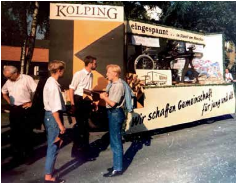
Festwagen der Kolpingsfamilie zum 40-jährigen Jubiläum der Gemeindegründung Geretsried am 27. Juli 1990